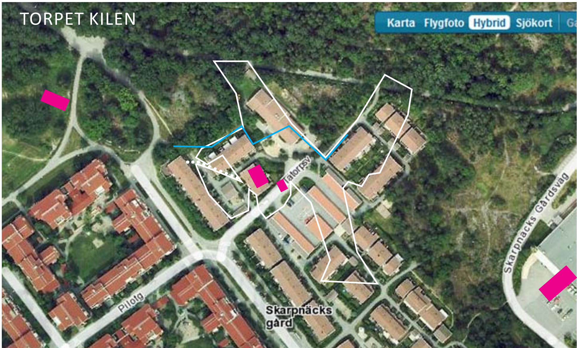
Flygfoto från Eniro (Lantmäteriet) (10-tal?) Allt utfyllt och hårdgjort, dagiset använder en del av odlingsmarken.