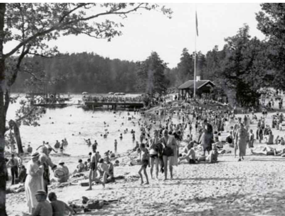
Stora badet i juli 1934. Utanför ”dansbryggan” rakt fram syns det hopptorn som fortfarande finns, men flyttat.

Badet anlades med en strand på 1 200 meter och en tillskapad sandplage på 18 000 kvadratmeter. Här fanns plats för upp till 15 000 badgäster. Byggnaderna ritades av arkitekt Paul Hedqvist.