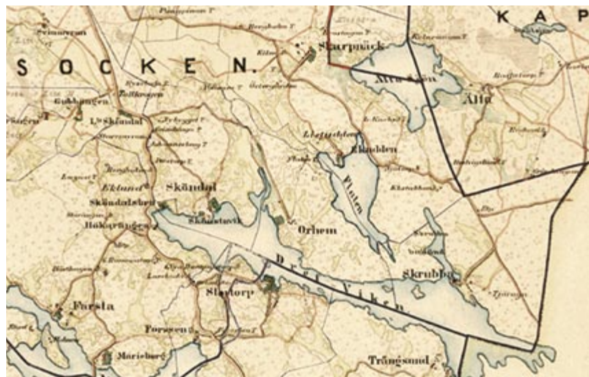
Utsnitt ur Häradsekonomska kartan från 1870

Ekudden övergavs så småningom och kom att stå övergivet en längre tid innan det blev tvångsinlöst av staden 1971 och kom sedan att brinna ner på sent 1970-tal.