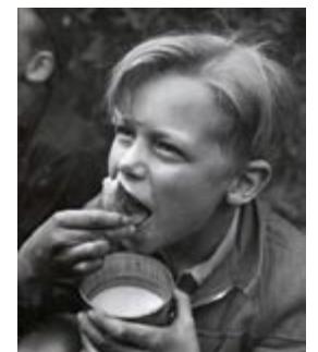
Matfällorna var indelade efter barnens ålder med flickor och pojkar för sig, 1943