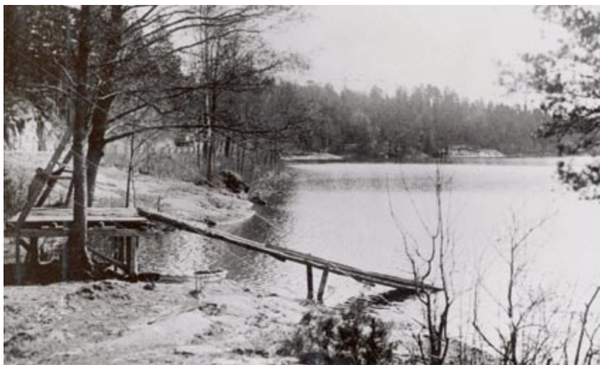
Området för barnbadet i april 1933. Nedan stora badet i april och juli samma år.

Våra lägerlivsidkare fortsatte dock med sitt tältliv. För inget kunde vara mer populärt än att åka ut till Flaten eller Älten och trängas med andra tältare och förmodligen, om man läser rätt mellan raderna, fanns det nog värmande drycker av den starkare sorten undanstoppat hos dessa tältande pionjärer.