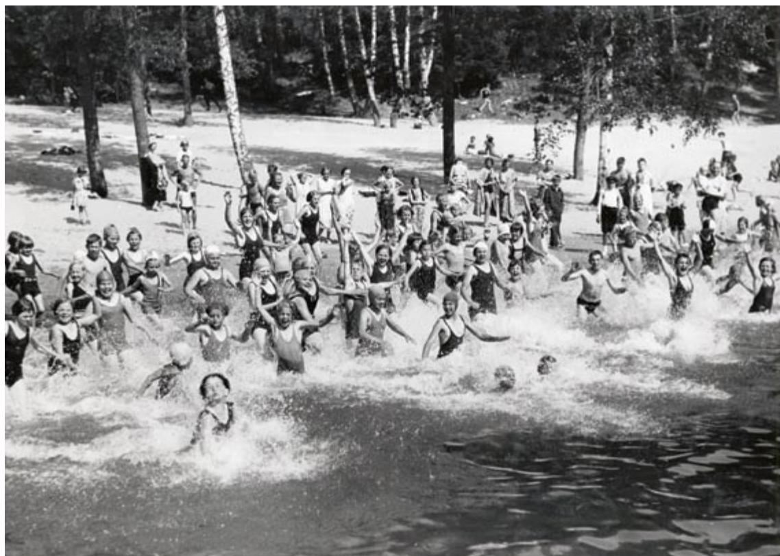
Barnbadet i juni 1934

skaffa bil och kanske t.o.m. åka på chartersemester. Nu fick föräldrarna nya möjligheter att ge sina barn tillgång till bad och sol. Badbussarna i sin traditionella form upphörde helt under 70-talet. Dock har Farsta fortsatt med egna badbussar ända till nu.