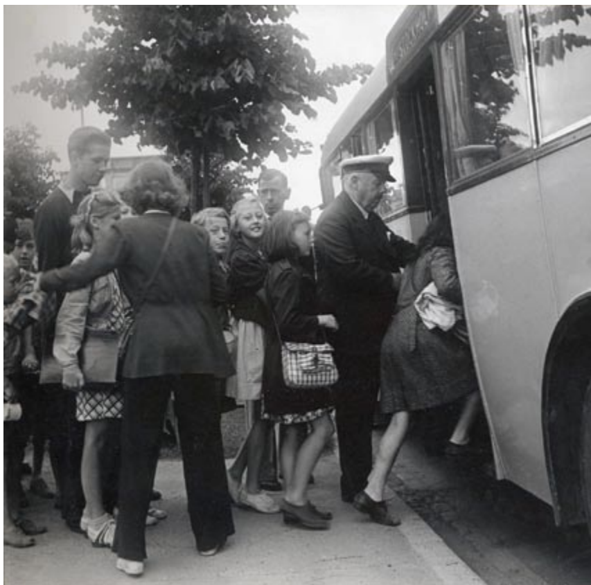
Från spårvagn till buss, Skanstull 15 juli 1942

Alla barn mellan sju och fjorton år var välkomna att, utan avgift, följa med. De som var under tio år måste ha sällskap av en äldre kamrat. Första gången ett barn kom till en badbuss registrerade det sig hos badvakten som fyllde i namn, adress och kontaktperson på en lapp av tjockt papper som bytte färg varje år. På lappen fanns rutor med veckor och dagar förtryckta. Alla barns lappar förvarades under dagen på en metallring sedan man på morgonen ritat ett halvt kryss över dagens ruta. I samband med hemresan på eftermiddagen fick barnen tillbaka sin lapp sedan badvakten gjort det kompletterade strecket på dagens kryss. På så sätt kunde man enkelt hålla reda på att de barn som varit med på morgonen också fanns med på hemresan. Att ha deltagit flitigt och ha många kryss gav hög status. Om något barn saknades var det