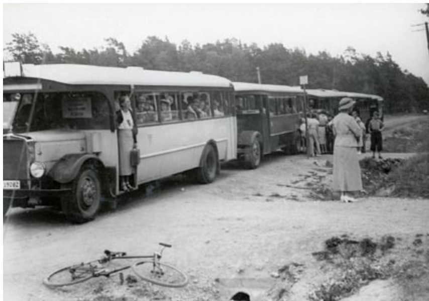
Badbussar vid Flaten i juli 1935

Redan året efter Flatenbadets invigning, 1935, började badbussarna gå till det som kom att kallas Barnflaten . Dessa badresor för barn hade ungefär samma upplägg från starten till slutet. Ett stort antal bussar hämtade under högsommaren upp barn från många uppsamlingsplatser på Söder och i Söderförort. Barnen fick sedan under mycket fria